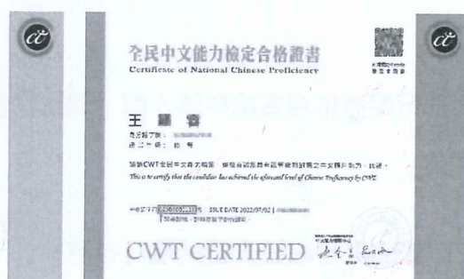
※高、優等證書證號示意圖