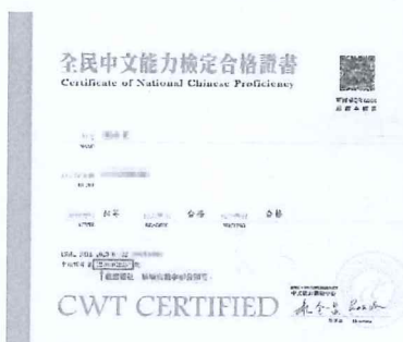
※初~中高等證書證號示意圖